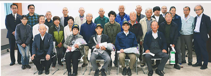
表彰を受けた出荷者ら

JAはだのは4月24日、本所でじばさんずの出荷者表彰式を開いた。出荷者をねぎらうとともに、生産意欲向上につなげることを目的。表彰要領に基づき、出荷者27人に記念品を贈呈した。同店は、2002年11