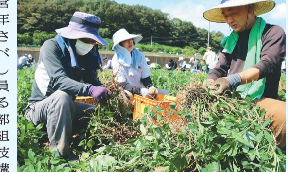
南支所運営委員会の落花生収穫体験(昨年)。多くの部員が出席した総会。

各支所運営委員会は、年間を通してさまざまなイベントを企画している。委員会を構成する理事や女性部員、地域の組合員らの特技を生かした講習会や、地域で生産している農作物の収穫体験など、地区ごとに特色を出す。今後の主な予定は右表の通り。