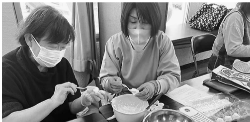
混ぜ合わせた材料をキャップに入れた

南・北支部 「ゴキブリ団子作り」 南支部は4月24日、北支部は5月10日、各支所で「ゴキブリ団子」を作った。タマネギ、小麦粉など家