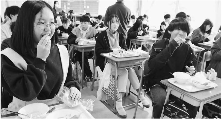
地場産農産物の給食を食べる中学生