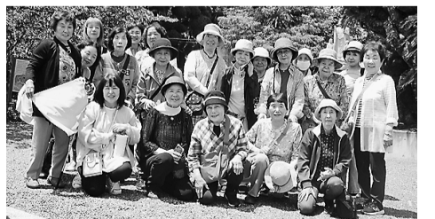
大福寺を訪れた部員

支部旅行 本町支部は17日、支部旅行で千葉県を訪れた。部員20人がグルメの旅を通して、親睦を深めた。部員は卵かけごはんの朝食を味わった後「はち