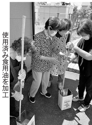
使用済み食用油を加工