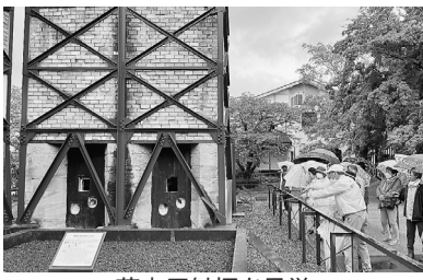
葦山反射炉を見学

女性部目的別趣味グループ「歩こう会」は13日、静岡県を訪れた。会員42人が、歴史的な建造物や