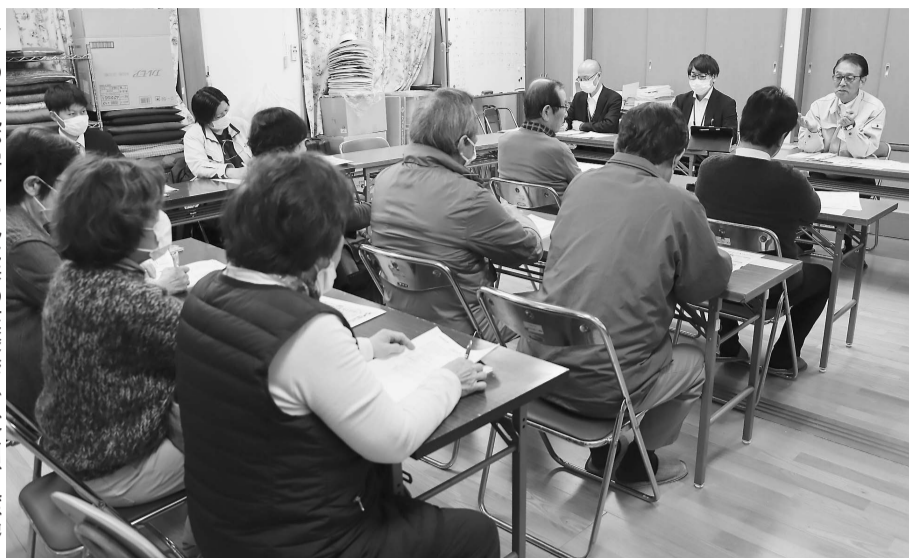
多くの意見が寄せられた春の座談会(上今川町会館)

落花生「郷の香」は、種子供給元である千葉県での種苗登録の期間満了に伴い、安定して種子を確保することが困難となったため、県やJA全農かながわと協議し、新たに「千葉P114号」を導入することになりました。千葉県では、いり豆向きの品種とされていますが、冷凍加工施設で試験加工したところ、食味・食感共に問題がなかったため「うでピー」の原料として使用可能と判断しました。