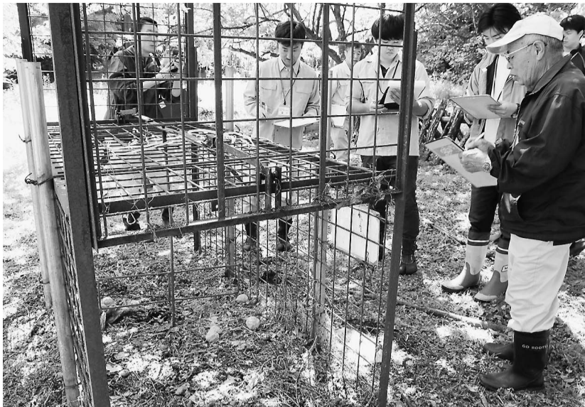
おりに仕掛けた餌や管理の状況をチェック