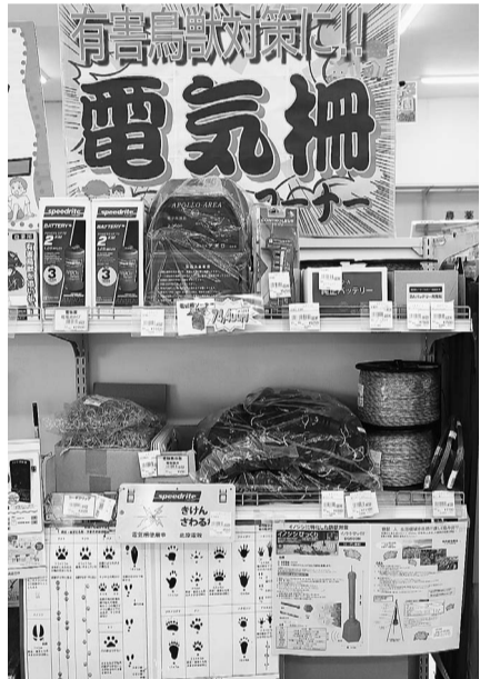
J Aグリーンはだのの電気柵コーナー