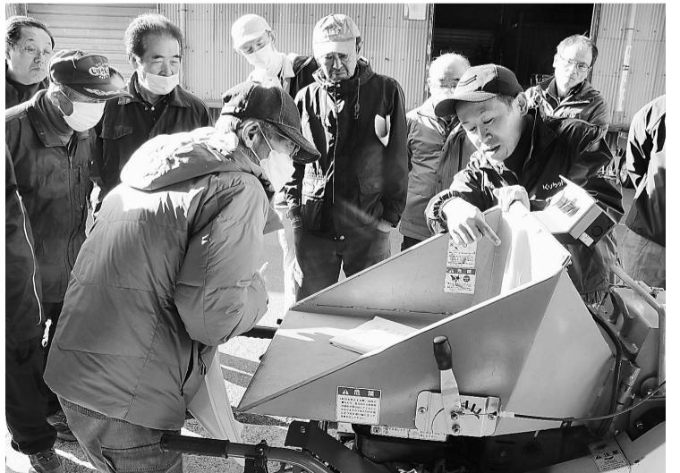
チップパーの使用方を説明した講習会

意見 未満の葬儀を家族葬・小規模葬として扱って、2023年度は78件の利用がありました。