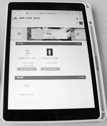
J Aねつと注文の画面

意見 東・西給油所の営業時間が数年前に短縮された。時期によって営業時間帯を変えてほしい。