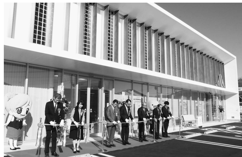
西支所がグランドオープン

回答 全国と比べる... 資配当率は高く、農協大会で「内部留保による自己資本の増強が必要で、各JAが剰余金処分の配当施策の見直しを進めること」が決議され、