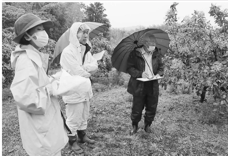
着花状況を調べるセンター職員ら

果樹部会柑橘(かんき)部は13日、市内にある部員の他、県農業技術センターの果樹園13園を巡回し、着花量を調べた。