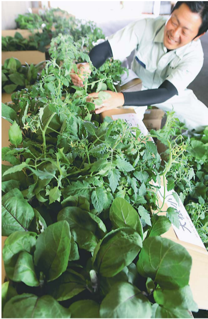
JA職員が仕分けた野菜苗