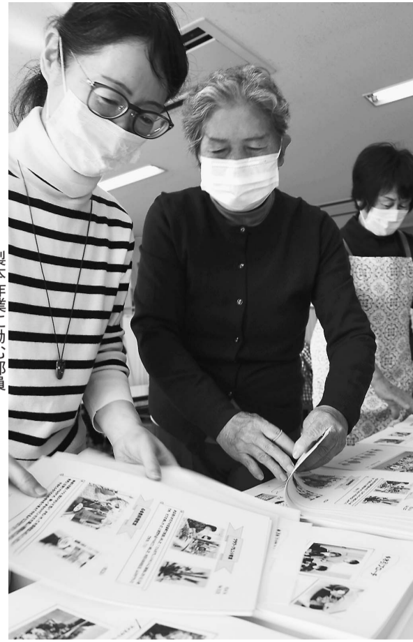
製本作業に励む部員