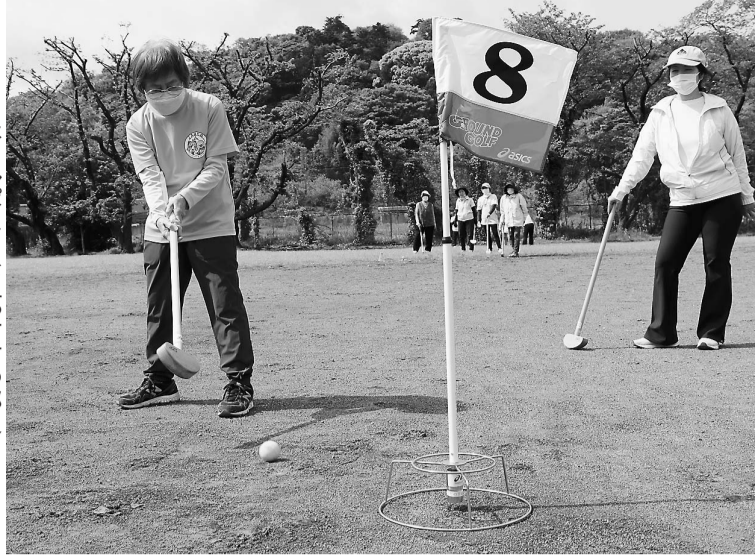
ホールポストを狙って打つ部員

私たちの班は、2人で活動しています。義母と共に加入した頃は、1、2班総勢13人で、食事会や毎年恒例の年度末の泊旅行などを企画し、親睦を深めていました。 しかし、高齢化や環境変化で班員は減少し、現状に至ります。 先日、班員のお宅で一緒にこんにゃく作りをするようになりました。作業をしながらのおしゃべり、その後にはお茶とお菓子を用意していただき、思いがけず久々に楽しい時間を過ごすことができました。 ようやくコロナ関連の規制も緩和され、女性部の行事も以前と同様にできるようになりました。これから健康に留意して、元気に楽しく活動に参加していきたいと思えます。