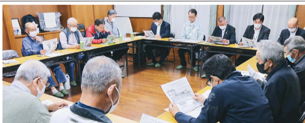
JAへの意見が上がった座談会(南矢名下部会館・大根地区)