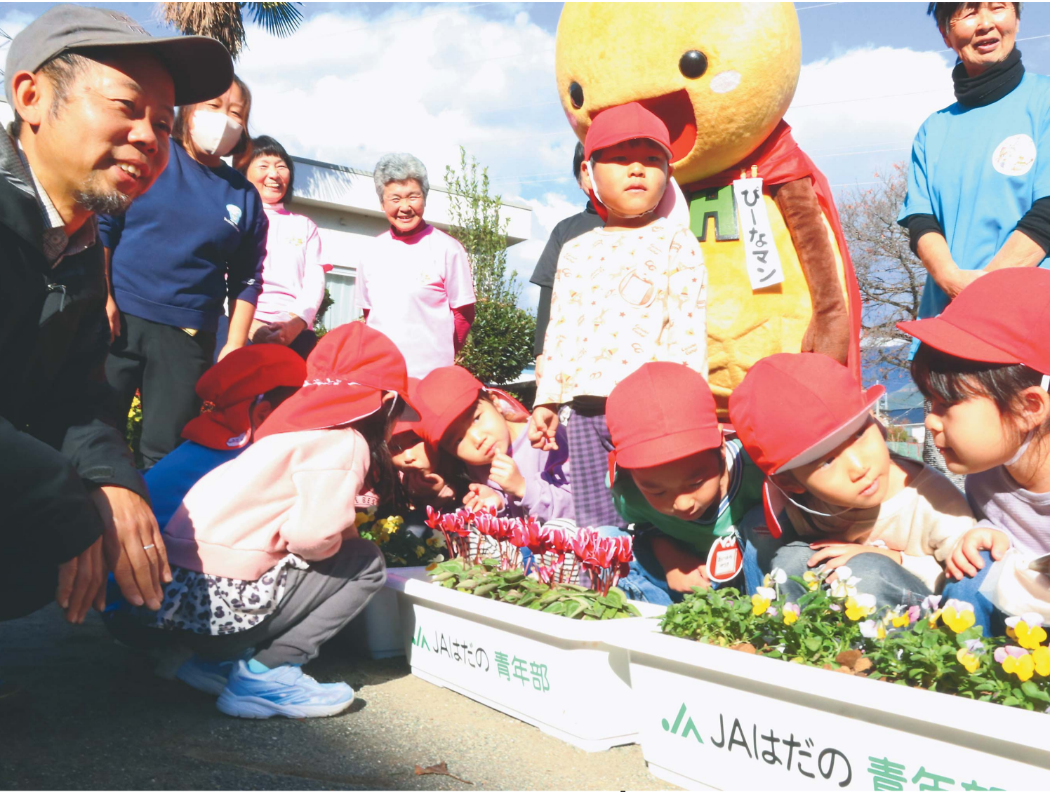
杉本委員長と女性部員が園児と交流

じばさんずは28日(土)午前9時から午後3時まで30日(月)の3日間、「年末市」を開催します。だるまやお飾り、農家の手作りおせち、年越しそばなど、年末年始にぴったりの品を豊富に取りそろえます。Sun's Gate(サンズゲート)は、ワンストップサービスを実施する他、持ち帰りシェラートも20%増量します。ぜひご来店ください。