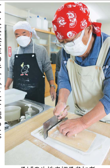
そばの生地を切る参加者

上支所運営委員会は11日、本所でそば打ち教室を開いた。そば作り教室を開いた。そば作り教室を開いた。そば作り教室を開いた。