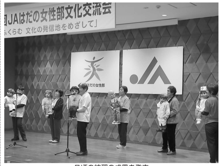
日頃の練習の成果を発表

女性部は8日、本所で第19回JAはだの女性部文化交流会を開いた。目的別趣味グループの活動発表を通じて新たな仲間への加入につなげ、部の活性化を図ろうと毎年企画。趣味グループのメンバーや来場者合わせて約200人が参加した。