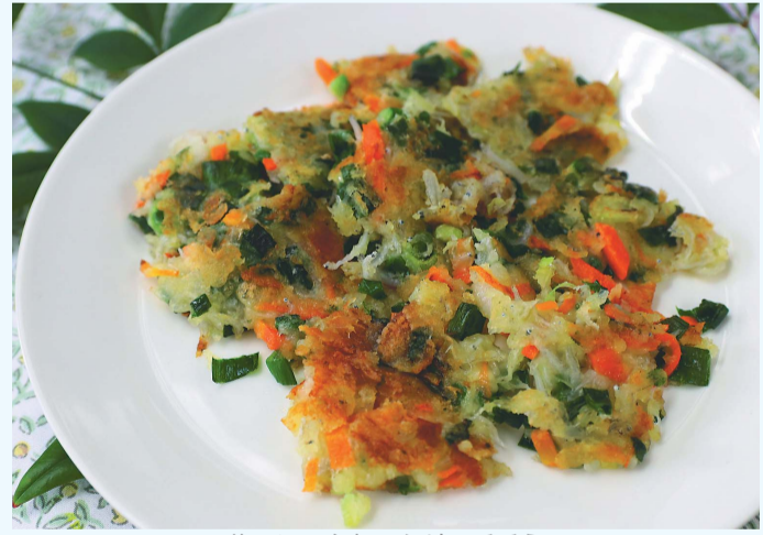
葉ニンニクたっぷりのチヂミ

葉ニンニクは、炒め物などの中華料理やキムチ、鍋物と相性が良く、いろいろな料理に使いやすい。ニンニク特有の風味があり、料理に加えることで香り良く仕上がる。