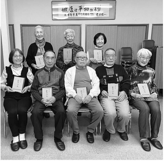
製本した「むぎぶえ」を手にする会員