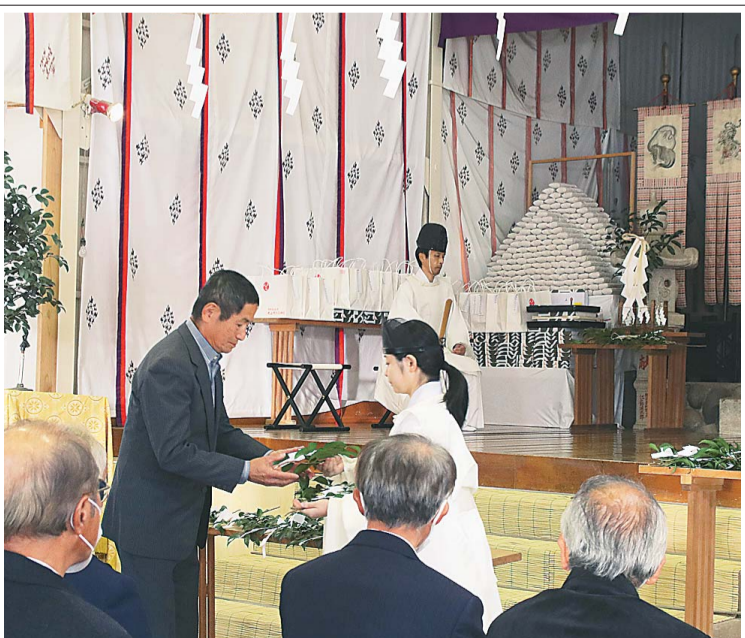
参列した組合員が玉串を奉納