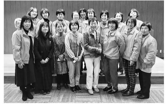
発表会に出席した部員

令和6年度生活文化活動体験発表会・神奈川県家の光大会が20日、横浜市のJAグループ神奈川ビルで開かれた。各JA部の代表者がテーマに合わせた各自の活動を発表。JAはだのからは部員18人が参加した。