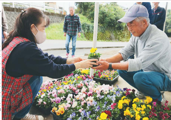
パンジーを手渡す諸星生産組合長(左)

菅浦第2・第3の二つの生産組合は11月22日、菅浦自治会館で組合員にパンジーを配布した。組合員に生産組合の構成員である意識を持ってもらい、結び付きを強化する取り組み。市内の花農家が生産した約260ポットを用意し、1世帯につき3ポットを手渡した。両生産組合には、所属する准組合員から「自分が加入しているのかわからない」「役員が誰なのかわからない」という声が届いていた。それを受け、准組合員にも帰属意識を持ってもらう方法を模索。年齢層や性別を問わず、生産組合全体を活性化させる活動として、組合員全戸を対象に花を配布した。組合員からは「花の少なくなる季節に、きれいなパンジーがもらえる」と好評を博し