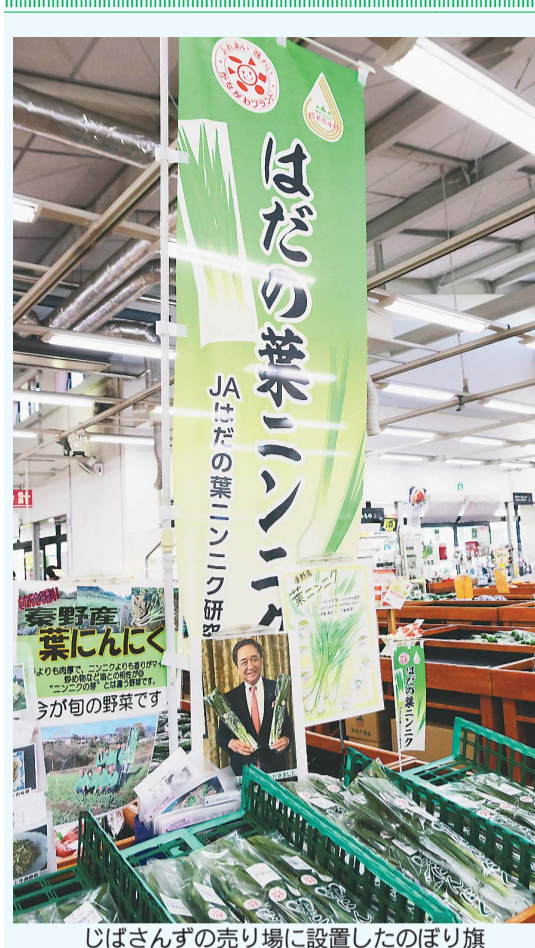
じばざんずの売り場に設置したのぼり旗

葉ニンニク研究会の「はだの葉ニンニク」は、認知度向上に一層力を注ぐ。今年「はだの葉ニンニク」の「かながわブランド」と市の「秦野優良農産物等」のぼり旗を製作。同