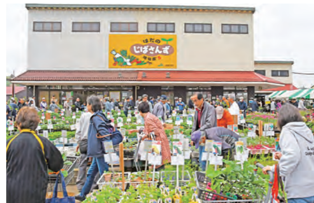
■園芸協会春まつり