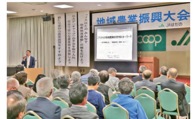
■地域農業振興大会