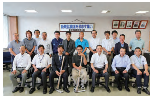
■新規就農者を励ます集い