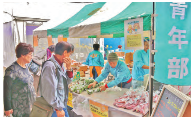
■ 青年部による対面販売ユースマルシェ