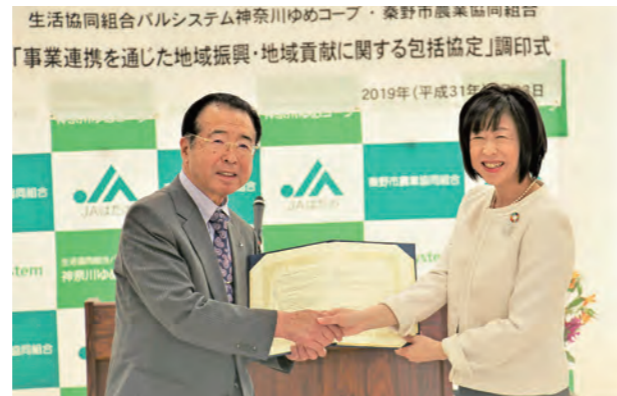
■パルシステムとの包括協定調印式