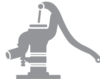
農業用の井戸・水道